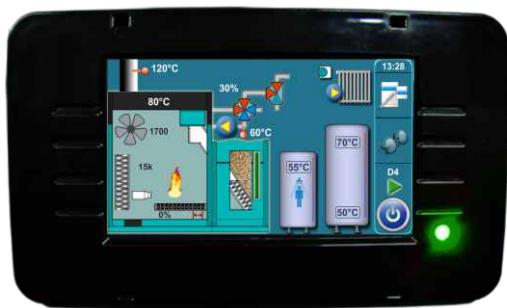
Več funkcijska upravljalnik z zaslonom na dotik.